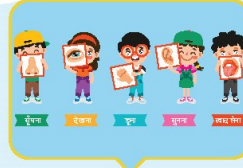
मैं और मेरा शरीर