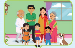
मेरा घर और परिवार